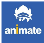
図2 アニメイト通販

国内最大規模のアニメグッズやキャラクターグッズが売っている店 全国どこからでも注文することが可能