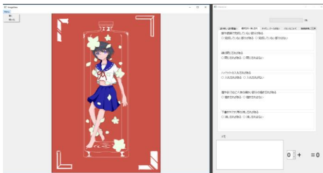
図1. アプリの全体図

客観的な視点を取り入れられるようにするために質問事項をチェックリストで表示した。また一人でも手軽に行えるように自動で縮小化を行うようにした。