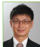
高橋 邦明 総務省 技術顧問 一般社団法人ガバナンスアーキテクト機構 専務理事 GAPS 代表