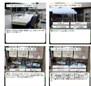
図2 ステージのクイズ