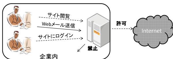
図 1: システム概要図

現在、企業での情報漏洩が問題となっている。その情報漏洩はハッキング、ウイルスなどの外部要因ではなく、内部の人間による情報の盗難、流出などの要因が多い [1]。その内部要因の一つとして、メールを利用したものがある。このため、多くの企業ではメールクライアントソフトを利用して発出されるメールの監視、規制を行うシステムを導入している。しかしこれらのシステムでは Web メールを規制することはできない。また、Web フィルタリングシステムを導入している企業もあるが、このシステムは暴力・アダルトなどの有害サイトの閲覧を規制する目的で開発されており、Web メールサイトを適切に規制することはできない。そこで本稿では、世の中に広く普及している Web メールサイト利用時のパケットの特徴を調査・検討し、Web メールの使用を検出・制限するシステム (図 1) の提案と設計を行ったので、以下にその概要を説明する。