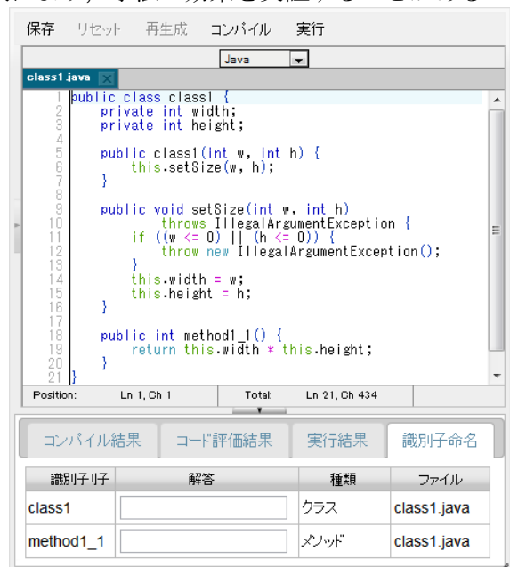
図 1 Web 教科書における学習画面例