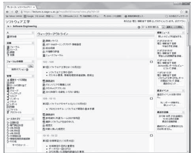
図-1 Moodleを用いた講義Webページ