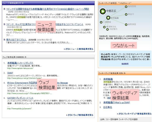
図 1: つなぐルートを含むプロトタイプ検索結果画面

た情報を取得できる可能性がある。一方、サイト運営者としては、この仕組みによるページビュー増が利益に直結する。