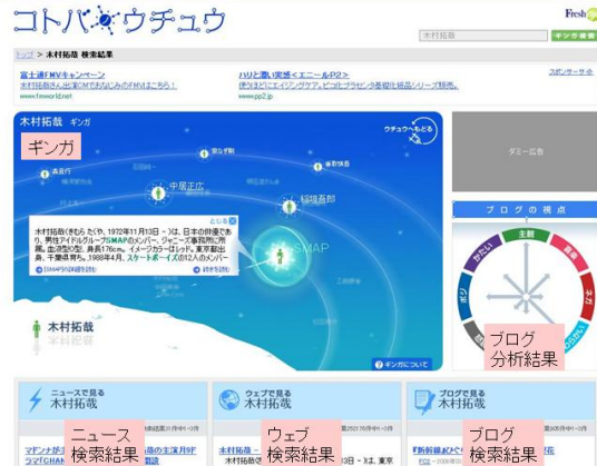
図 4: ギンガと検索結果の画面