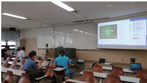
図-1 分科会等運営の様子

パブリックビューイング会場として交通の便を考え、工学院大学新宿キャンパスをお借りした。残念ながら、直前で新型コロナウイルス感染症の感染者数が増加していたこともあり、自治体によってはパブリックビューイング会場への出張が認められず、パブリックビューイングへの事前申し込みに対し、実際の参加者が少なかったのが悔やまれる。なお、会場が分散すると運営が煩雑になるため、大会の運営場所も工学院大学新宿キャンパスとした(図-1)。