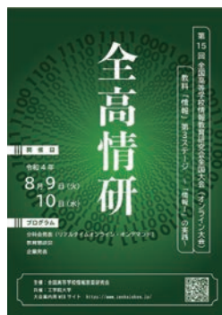
図-2 大会冊子のオンライン販売 https://www.amazon.co.jp/dp/B0B67XKMWZ

情報Iは、「(1)情報社会の問題解決」「(2)コミュニケーションと情報デザイン」「(3)コンピュータとプログラミング」「(4)情報通信ネットワークとデータの活用」の4つの領域から構成されている。今回