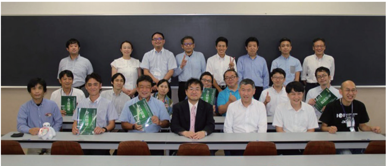
図-3 運営会場で運営にかかわった実行委員たち

2005年情報科教諭として東京都に採用。現在、東京都立小平高等学校指導教諭、東京都教職員研修センター認定講師等。