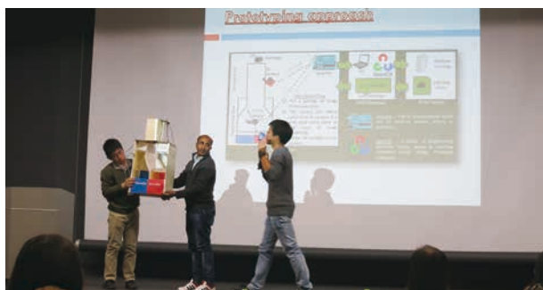
図-3 最終発表会の様子

学修成果のアセスメントを参加各国の学生に対し実施し、結果を参加校にフィードバックしている。グローバルPBLの学修教育目標に沿って、個人の学修成果とプロジェクトの成果に対するルーブリック(評価水準表)を設計した。PBLの開始時に個人の自己評価を行い、PBLの終了時には、個人の学修成果に対して自己評価と学生間の相互評価を行う。一方、プロジェクト成果に関しては、教員評価とグループ間評価を実施する。その結果、国内外の学生ともに「多文化、多分野のチームで活動する能力」に関して自己評価、学生相互評価ともに高い値を示した(図-3) 4) 。