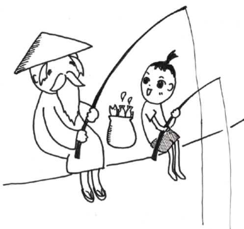
図-1 「授人以魚不如授人以漁」(老子) 「魚(試験問題)を与えるのではなく、魚の釣り方(試験問題の作り方)を教えよ」 「授人以題不如授人以製題之法」