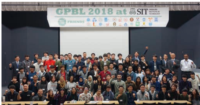
図-1 グローバル PBL のオープニング