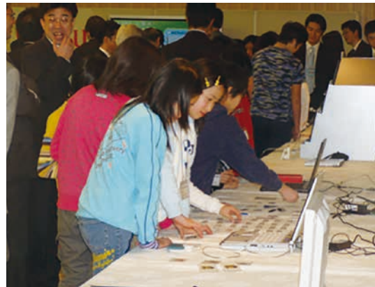
図-1 第1回目開催の様子