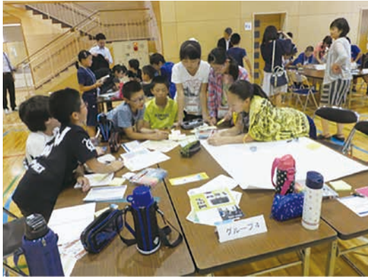
図-5 2016年度開催の様子