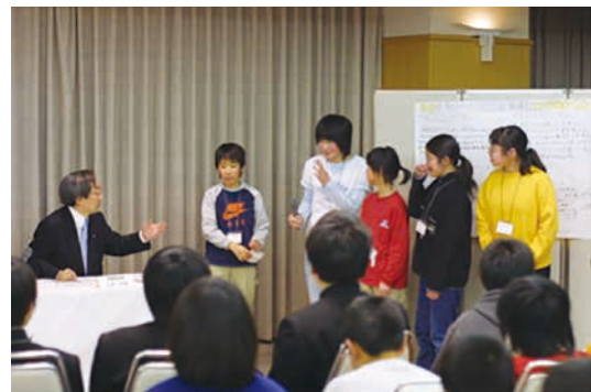
図-2 第1回目開催の様子