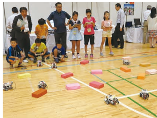
図-4 2016年度開催の様子