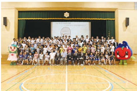
図-8 2016年度開催の様子

子供たちは、普段はあまり触れることのできないICTの最新技術を驚き、楽しんでいる(図-5, 図-6, 図-7, 図-8)。父兄や先生方も楽しんでいるようだ。