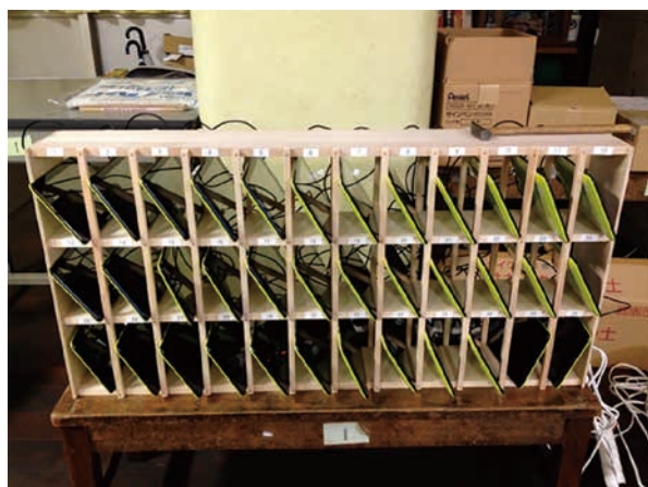
図-1 タブレット端末保管庫

同校では全学年を通じてPCを中心とした情報機器の活用等を学ぶ専門科目「情報科」を1999年から設置し、専任教員による情報教育指導を行っている。情報科の授業では、情報活用能力(たとえば、タッチタイピングの習得やWeb検索技法、情報モラル、プログラミング、3Dプリンタの活用、パワーポイントによる発表、など)や、情報の科学的理解(たとえば、インターネットとWebページ、電子メールの区別など技術的な内容を扱う学習)を専門的に学ぶ内容を扱っている。