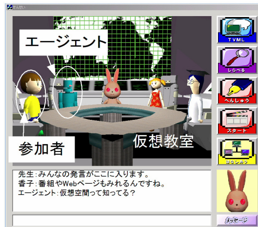
図2: 仮想教室画面例

ネットワークを通じたグループ学習では、グループの構成要因が動的であるため、テキストの送受信だけでは発言者を特定しにくいという問題点がある。そこで、学習参加者のIDと発言内容を元に、発言者の特定がしやすく、見ていて飽きの来ない映像を自動付加するため、実際に放送された討論番組(42対談、30時間、9000カット)を様々な角度から分析し、映像演出の統計的算出を行いこれを実装した。