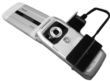
図 2: 実験に用いた携帯電話端末