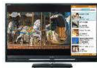
テレビ (ソニー製液晶テレビ〈ブラビア〉)