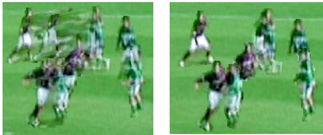
(c) (a)による中間視点画像 (d) (b)による中間視点画像

図1：選手境界領域の正確な切り出し(b)により生成した中間視点画像(d)と、自動処理による不正確な切り出し(a)に基づいて生成した中間視点画像(c)の比較。選手の重なりにより(a)では大きく画質が劣化していることがわかる。