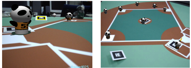
(a) 選手(キャラクター)視点 (b) 全体を俯瞰する視点

今後は、この技術を実際の放送番組制作に利用するための方法について検討していく予定である。