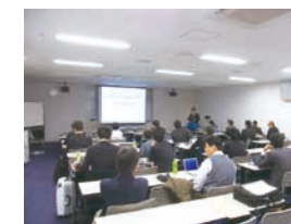
オーディオビジュアル複合情報処理研究会@福井市

40の研究会があり、専門分野ごとに最先端技術の研究を行っています。国際会議、シンポジウム、研究発表会など多くの交流の場を提供します。