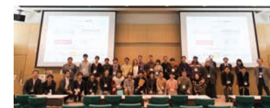
国際AIプログラミングコンテスト SamurAI Coding 2015-16@慶應義塾大学

IFIP(情報処理国際連合)に日本を代表して加盟しています。また、IEEE、IEEE-CS、ACM、KIISE(韓国)、CSI(インド)、CCF(中国)など海外学協会と提携して国際会議など、情報交換・交流の場を提供しています。