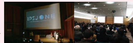
IPSJ-ONE 第78回全国大会@慶應義塾大学

年1回(春)に3,000人規模の大会を開催します。会員の成果発表の一般講演に加え、招待講演、パネル討論などのイベントも実施します。