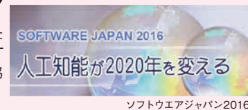
ソフトウェアジャパン2016

ITプロフェッショナルのためのシンポジウムです。ITフォーラムや連携する学会からの講演もあります。